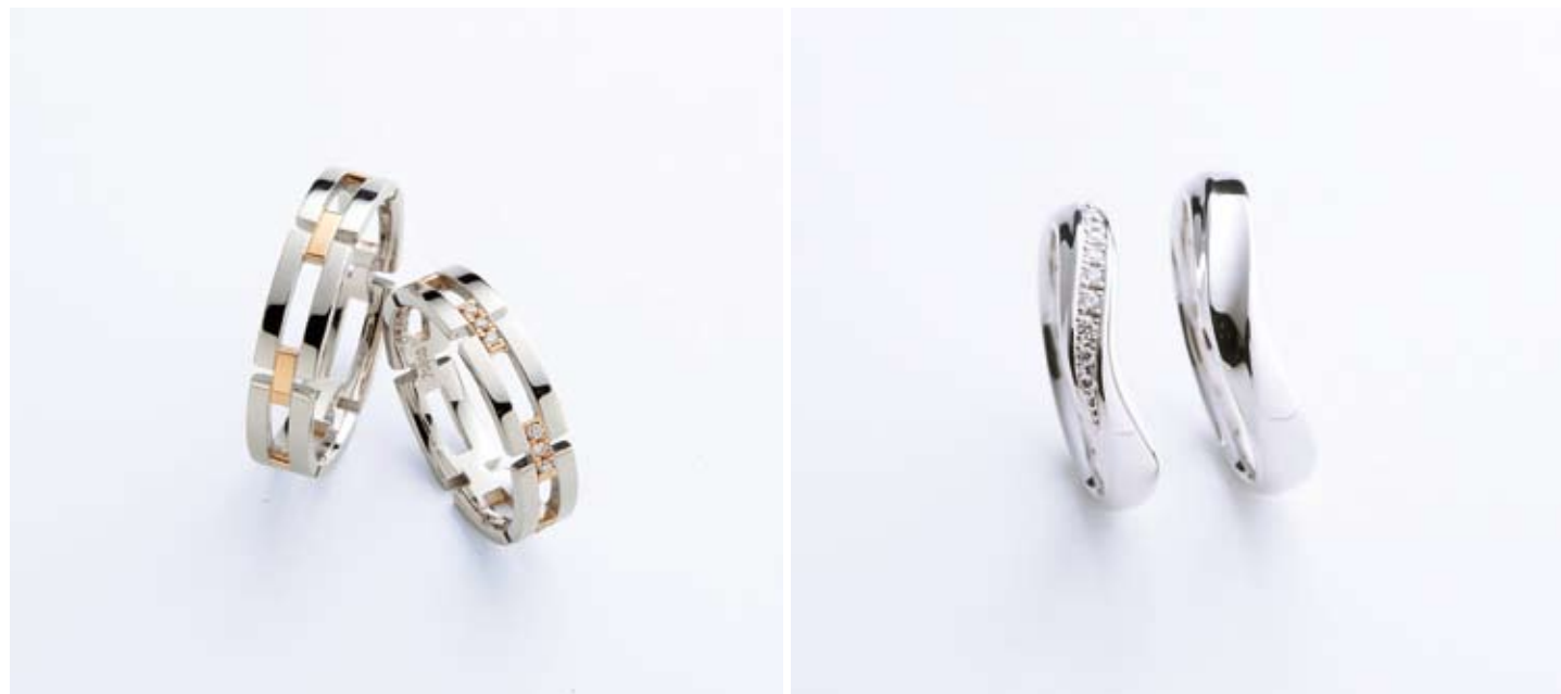
【Le Cadeauシリーズ ジョウワイユ】左/132,300円、右/159,600円

リングに愛着が生まれる 共同作業が一生の思い出に デザイン案から型作り、リングの仕上げの研磨まで、カップル自ら手掛ける完全ハンドメイドシステムを新潟でいち早く採用した専門店。素材、デザインともにどんなに高価なリングよりも貴重なオリジナルリングを制作できる。熟練クラフトマンのサポートにより、未経験のカップルでも安心を。1日3時間程度、計2回の来店で完成するため、無理のないスケジュールで進められるのも魅力的だ。 高度なリフォーム技術で ジュエリーがよみがえる 母親から譲り受けた婚約指輪のサイズ直しや現代風アレンジなど、さまざまなリメイクにも対応。卓越したクラフトマンの技術により、満足のいくデザインを約束してくれる。雑誌の切り抜きを持参したりなど希望のイメージを伝えるだけで、オーダーから約2〜3週間で納品。その仕上がりの美しさから、以前リフォームした人がまた別の指輪を持ってきてアレンジを依頼するケースも多い。