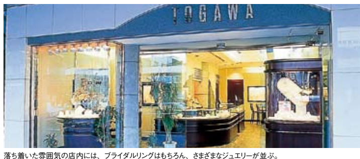
落ち着いた雰囲気の店内には、ブライダルリングはもちろん、さまざまなジュエリーが並び。