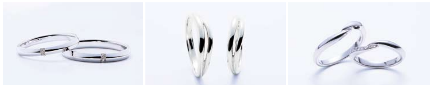
戸川オリジナル【結シリーズ】左/46,200円、右/52,500円