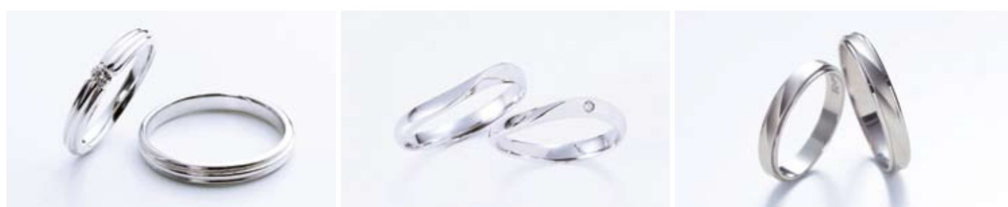
戸川オリジナル【結シリーズ】左/84,000円、下/60,900円