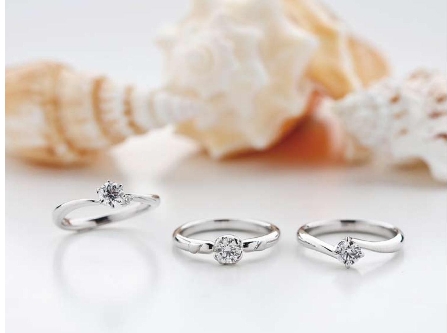
ハイクオリティなダイヤモンドをあしらったリングが手に入るのは宝石の専門店だからこそ。品質はもちろんのこと、幅広いデザインに対応できる高度な技術にも定評がある。