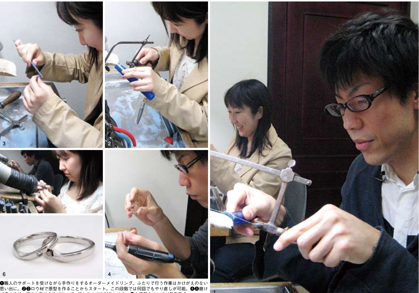
①職人のサポートを受けながら手作りするオーダーメイドリング。ふたりで行う作業はかけがえのない思い出に。②ロウ材で原型を作ることからスタート。この段階では何回でもやり直しが可能。③磨けば磨くほど、輝きや着心地がアップ。楽しみながら制作しよう。④大満足のリングが見事完成。