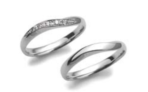
「NNコレクション」左/68,880円、右/54,180円