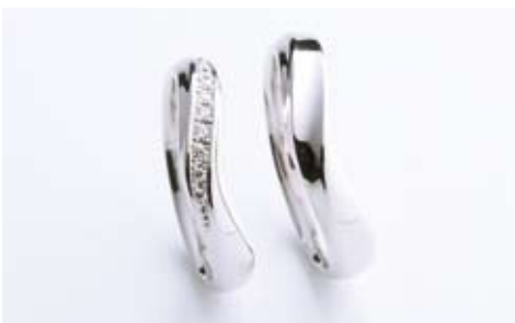
戸川オリジナル「絆シリーズ」左/84,000円、右/75,600円