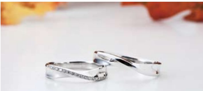
戸川オリジナル「絆シリーズ」左/69,300円、右/54,600円