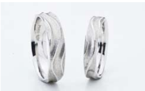
戸川オリジナル「匠シリーズ 水沫」左/94,500円、右/73,500円