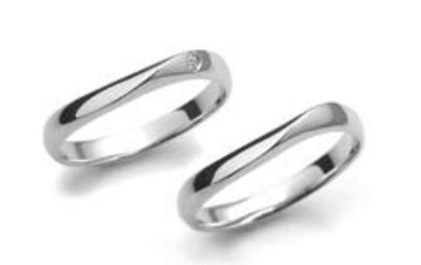
「NNコレクション」左/57,120円、右/54,180円