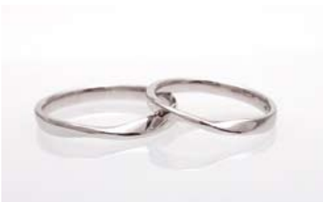
戸川オリジナル「結シリーズ」左/46,200円、右/39,900円