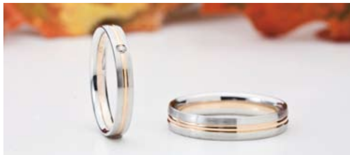
「Le Cadeau」シリーズ ラフィーネ」左/100,800円、右/121,800円