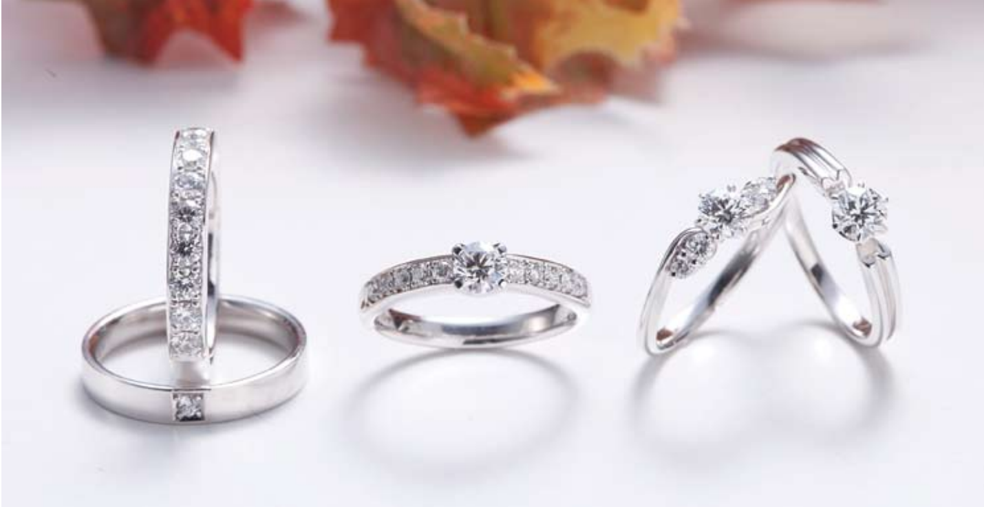
宝石の専門店ならではのハイクオリティなダイヤモンドを使ったエンゲージリング。美しく輝くダイヤモンドで、花嫁も自然と笑顔に。