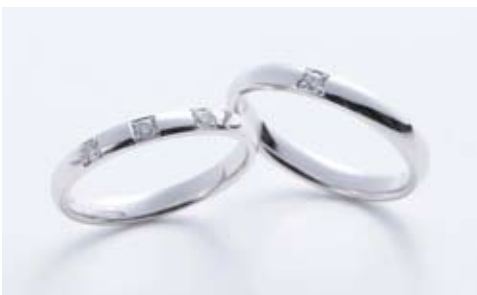
戸川オリジナル「結シリーズ」左/52,500円、右/50,400円