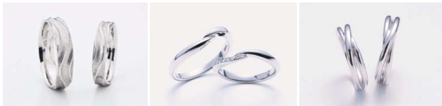
戸川オリジナル「匠シリーズ 水泳」左/94,500円、右/73,500円