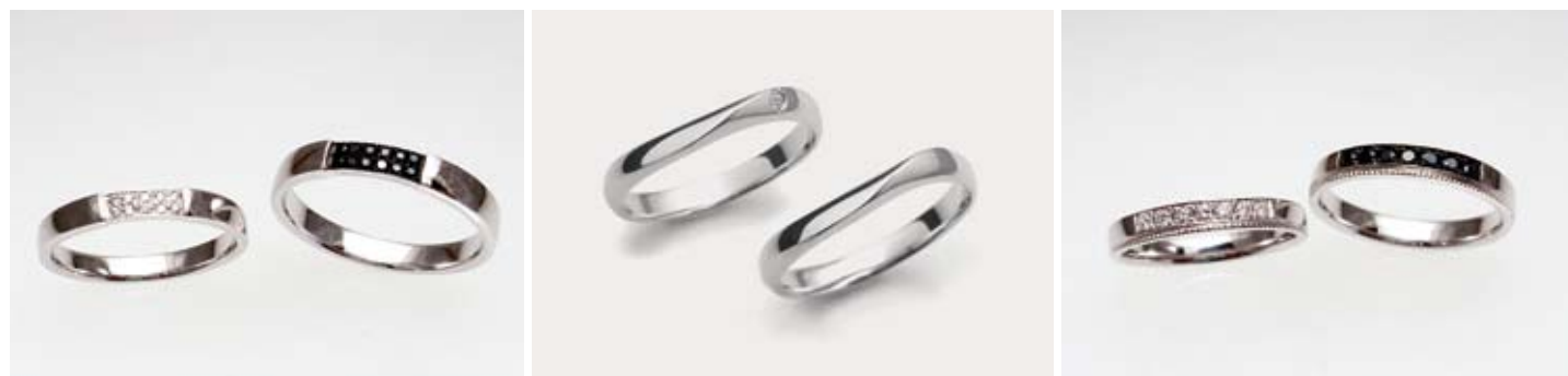
「Black&White」シリーズ」左/52,500円、右/66,150円