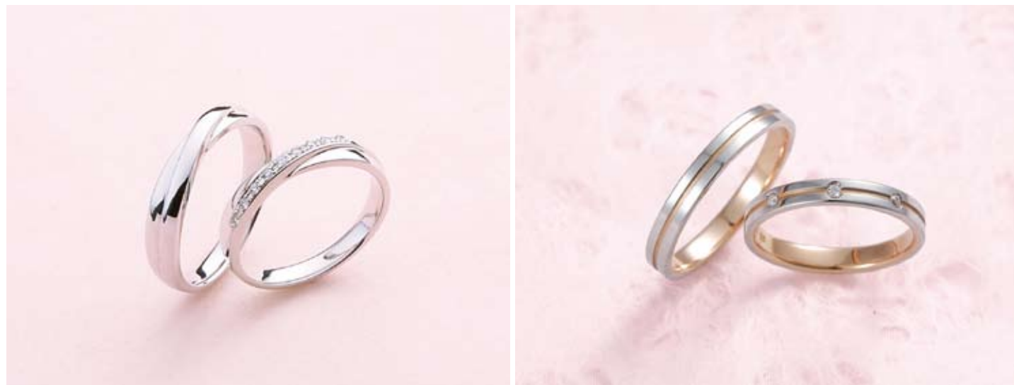
戸川オリジナル「絆シリーズ」左/66,150円、右/81,900円

理想のリングが手に入る フル&セミオーダーリング デザインから加工、金属の研磨まで、ほぼ全行程をふたりが手作りする、ハンドメイドシステムを採用している専門店。素材、デザインともにこだわりを生かしたオリジナルリングは貴重で、制作作業は結婚記念の楽しい思い出に。熟練クラフトマンのサポートで1日3時間程度、計2回の来店で完成。忙しいふたりも安心して利用できる。店内にはさまざまなリングがあるから参考にしよう。 手作りリングで刻む思い出 クラフトマンが安心対応 手作りだけでなく、熟練クラフトマンによるオーダーメイドも人気。予算に合わせて完全オリジナルからセミオーダーまで、希望のデザインに仕上げられる。自社工房で仕上げまで担当するシステムにより、想像以上にリーズナブルで高品質のリングが手に入ると好評。もちろん、内側のメッセージ刻印やダイヤモンドのセッティングなど、ふたりの感性を生かしたアレンジも自由自在だ。