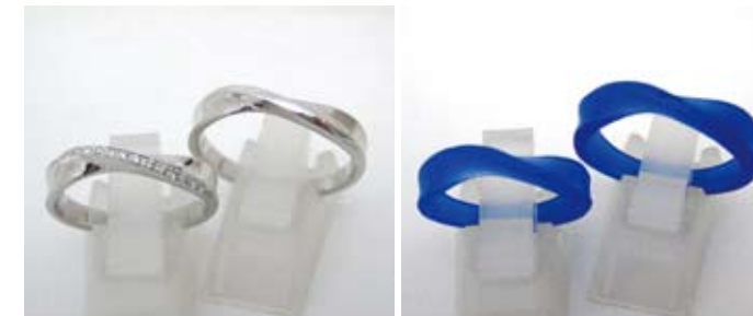
右はワックスで作った型。左は実際のリング。