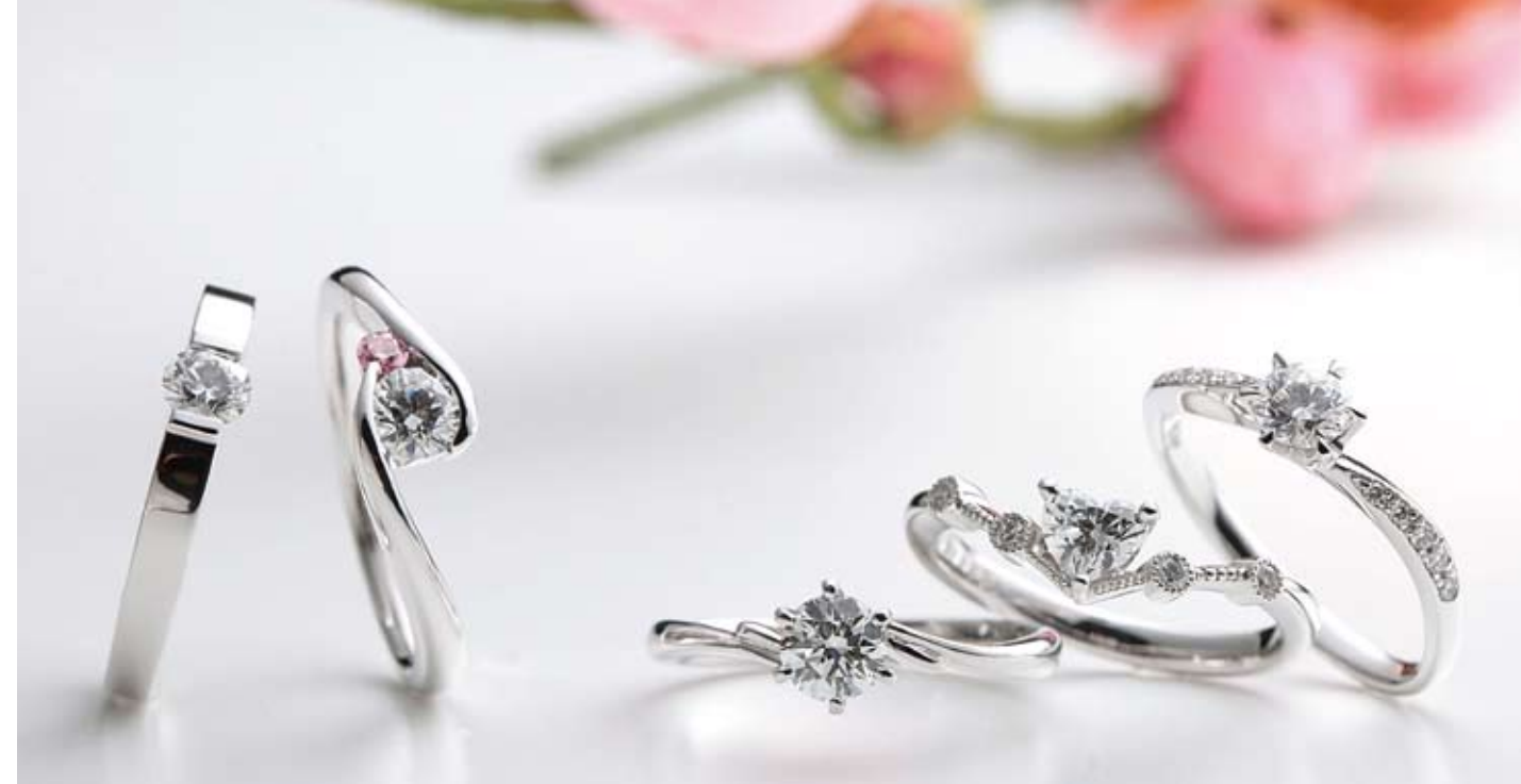
ハイクオリティなダイヤモンドをあしらったリングが手に入るのは宝石の専門店だからこそ。品質はもちろんのこと、幅広いデザインに対応できる高度な技術にも定評がある。